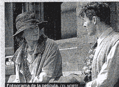
Fotograma de la película.