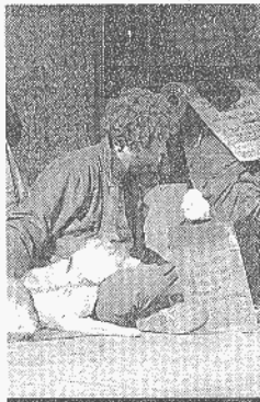
Indigente en el centro. H. SASTRE

De hecho, en Valladolid funcionan el comedor del Calderón -donde almuerzan a diario un centenar de personas- y el albergue para indomiciliados, con capacidad para que pernocten cincuenta personas. A esta red municipal se suman recursos de otras entidades, con las que los ciudadanos pueden colaborar económicamente en vez de dar limosna.»